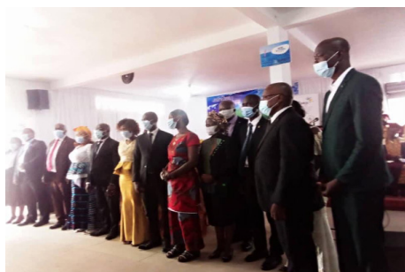
Costa de Marfil

Alabemos a Dios por los diversos servicios de ordenación que tuvieron lugar en nuestra región: Costa de Marfil, Sudáfrica, Mozambique, Angola y Cabo Verde. Celebramos la forma en que Dios sigue llamando a las personas en África. La Iglesia en África está respondiendo y madurando.