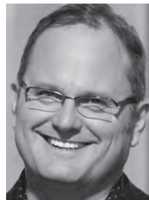
Marcos Witt Fundador de LIDERE