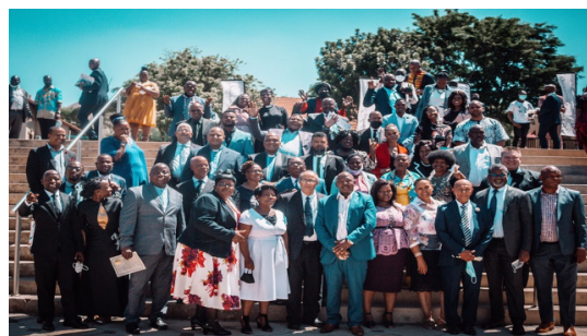
Lafrik di sid